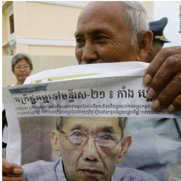
Schlagzeilenträchtig: die Verurteilung eines der Funktionäre des ehemaligen Schreckensregimes der Roten Khmer in Kambodscha.