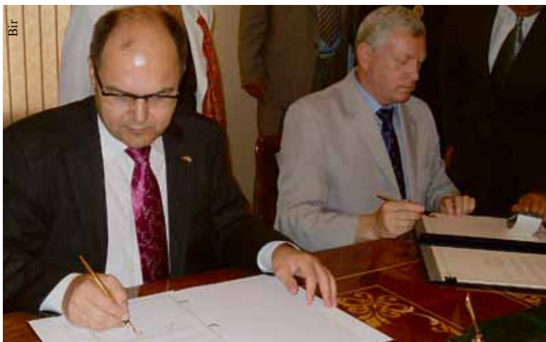
Signal: Schmidt (l.) und Andriusik unterzeichnen das Abkommen.

Kiew. Ein Abkommen zur Zusammenarbeit im Bereich des Geoinformationswesens unterzeichneten der Parlamentarische Staatssekretär beim Bundesminister der Verteidigung, Christian Schmidt, und der Stellvertretende ukrainische Verteidigungsminister Borys Andriusik am vergangenen Dienstag in Kiew. Es beinhaltet die künftig gemeinsame Nutzung und Auswertung von Kartenmaterial. „Dieses Abkommen ist eine vertrauensvolle Grundlage und ein Signal für die weitere Zusammenarbeit, die sich auch auf andere Bereiche ausdehnen wird“,