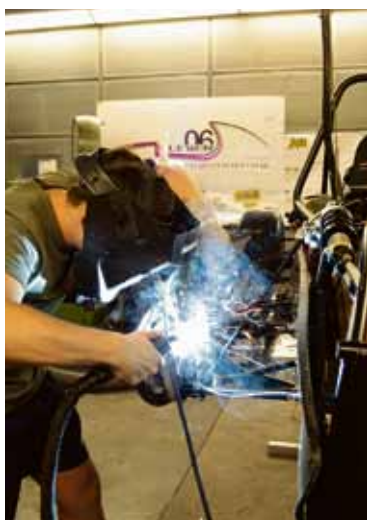
Planung und Bau: Die Studenten konstruieren den Rennwagen.