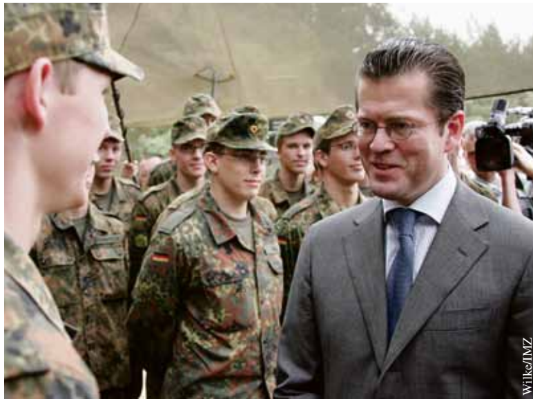
Direkte Kommunikation: der Minister (r.) im Gespräch mit Soldaten.

Der Minister machte deutlich, dass für ihn der persönliche Kontakt mit Soldaten aller Dienstgrad-