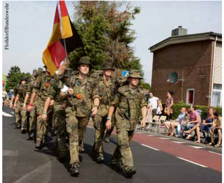
Auf der Strecke: eine von 13 Marschgruppen der Bundeswehr.

Nach der Moderatorenfrage „Germany are you ready?“ starteten die Marschgruppen auf die einzelnen Strecken der „4Daagse“. Was die Soldaten dann entlang der Marschroute erwartete, war vor allem für die Erstteilnehmer ein einmaliges Erlebnis. Es herrschte Partystim-