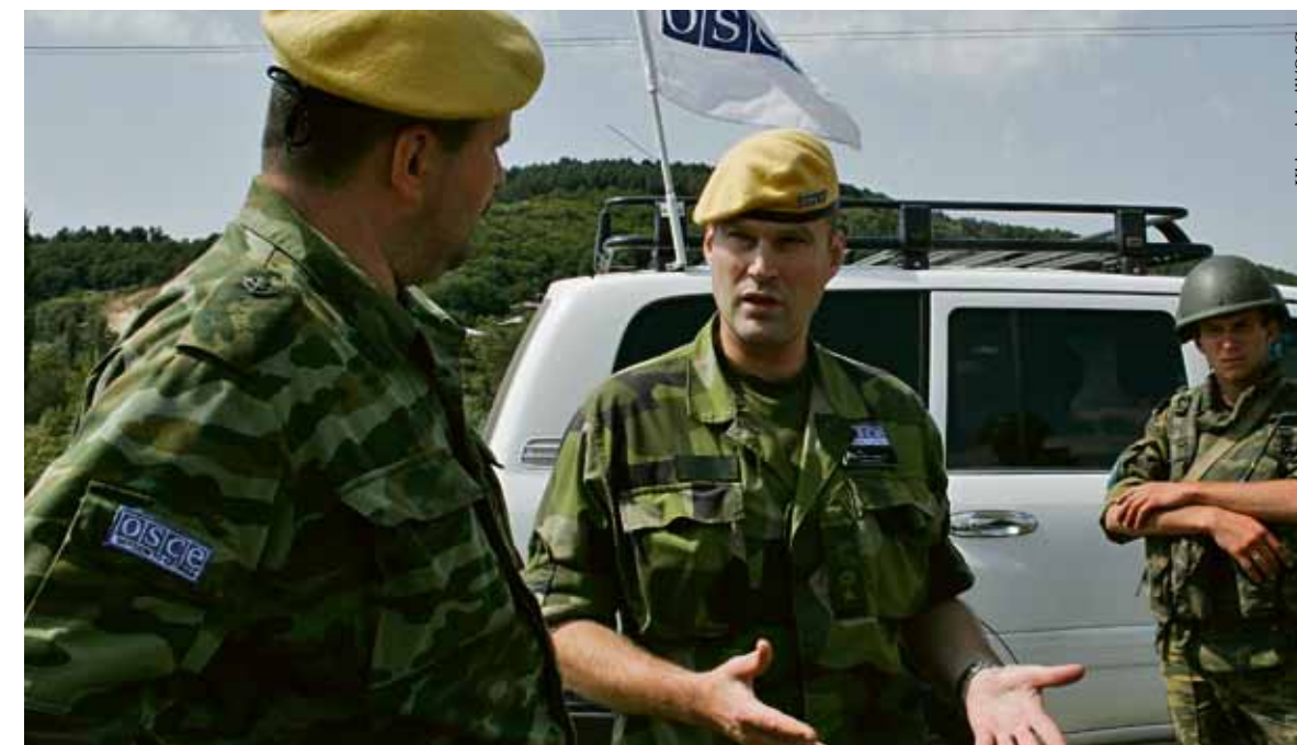
Mission beendet: Von 1992 bis Dezember 2008 war die OSZE auch in Georgien mit Beobachtern präsent.