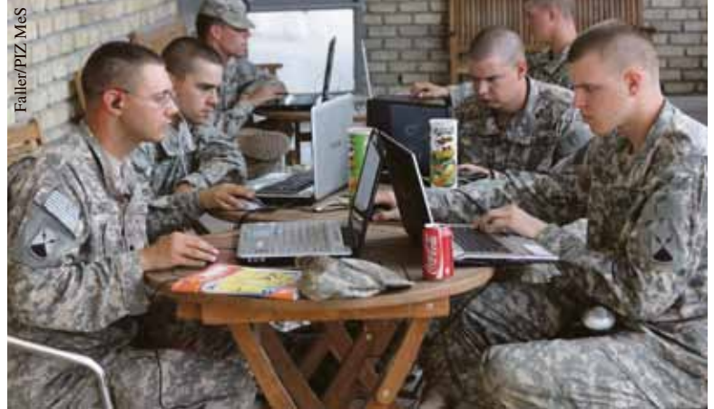
Mittels WLAN verbunden: amerikanische Soldaten im Camp Marmal.

Überaus wichtig und von den Soldaten heiß begehrt, sind in diesem Zusammenhang die Grüße von zu Hause via Feldpost und Radio Andernach . Denn so merken die Soldaten, dass Sie nicht in Vergessenheit geraten. Die Möglichkeiten zu telefonieren und das Internet zu nutzen, haben für die Soldaten im Einsatz aber ebenfalls eine große Bedeutung. In den Betreuungseinrichtungen werden deshalb entsprechende Möglichkeiten vorgehalten, wenn häufig auch in einem noch ausbaufähigen Umfang. Die alliierten Partner scheinen diesbezüglich schon weiter zu sein.