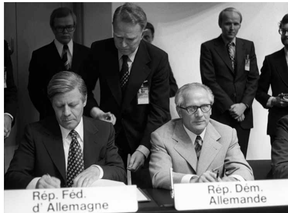
Verhandlungsende: Bundeskanzler Helmut Schmidt (l.) und der erste Sekretär des Zentralkomitees der SED der DDR, Erich Honecker, unterschreiben die KSZE-Schlussakte.

wurden. Diesen entsprechen bis heute die „Dimensionen“ der OSZE. Korb I listete in einem Prinzipienkatalog Grundregeln für das friedliche Zusammenleben der europäischen Staaten auf. In der Praxis boten diese teils widersprüchlichen Prinzipien aber bis 1989 immer wieder Gründe für Grundsatzdiskussionen der Unterzeichnerstaaten. Während der Westen auf Umsetzung von Menschenrechten und Grundfreiheiten pochte, verwies der Osten im Gegenzug auf das Prinzip der Nichteinmischung in innere Angelegenheiten. Korb II definierte die Bereiche der zukünftig blockübergreifenden Kooperation in Europa: Wirtschaft, Forschung, Umwelt und Sicherheit. Gerade letzteres blieb in Helsinki aber weitgehend unspezifisch. Nur mit Mühe gelang es den westdeutschen Unterhändlern, einen Verweis auf „vertrauensbildende Maßnahmen“ im Text unterzubringen, der später insbesondere durch die Stockholmer KVAE-Verhandlungen (Konferenz über Vertrauensbildung und Abrüstung in Europa) zwischen 1984 und 1986 präzisiert wurde. Das daraus resultierende Stockholmer Dokument vom September 1986 bildete die Grundlage für die Aufgaben der Manöverbeobachter aus der Bundeswehr und der Natio-