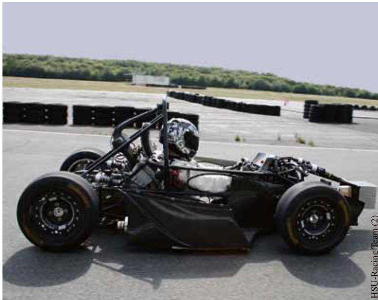
Schnell unterwegs: Der R.U.S.H. 10 läuft bis zu 120 Stundenkilometer.

Doch diese Revolution hat auch einen Preis. Elf Monate haben die zwei Frauen und 34 Männer an ihrem neuen Wagen gearbeitet. In den letzten Wochen vor dem Rollout am 17. Juni sogar oft bis tief in die Nacht. Dann präsentierte ein völlig übermüdetes aber stolzes Team seinen R.U.S.H. 10 den Medien und den Fans an der Universität.