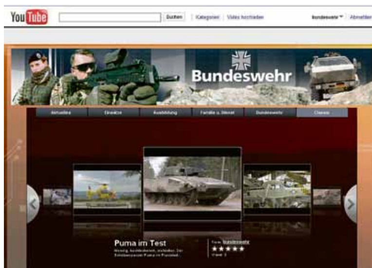
Auftritt im WorldWideWeb: Der Bundeswehr-Kanal auf YouTube .

Doch nicht nur die deutschen Streitkräfte präsentieren sich auf der YouTube -Plattform. Neben den britischen Marines stellen auch die rumänischen oder US-Streitkräfte ihre Fähigkeiten dar. Die Ansätze, wie die Online-Plattform dabei genutzt wird, sind verschieden. Während die Briten und Niederländer ihren Schwerpunkt auf die Nachwuchsgewinnung legen, konzentrieren sich die Australier auf das Bild der Soldaten in der Gesellschaft: Mit ihrem Beitrag „Airmens Code“ zeigen sie nicht nur die Soldaten, sondern die Menschen in der Luftwaf-