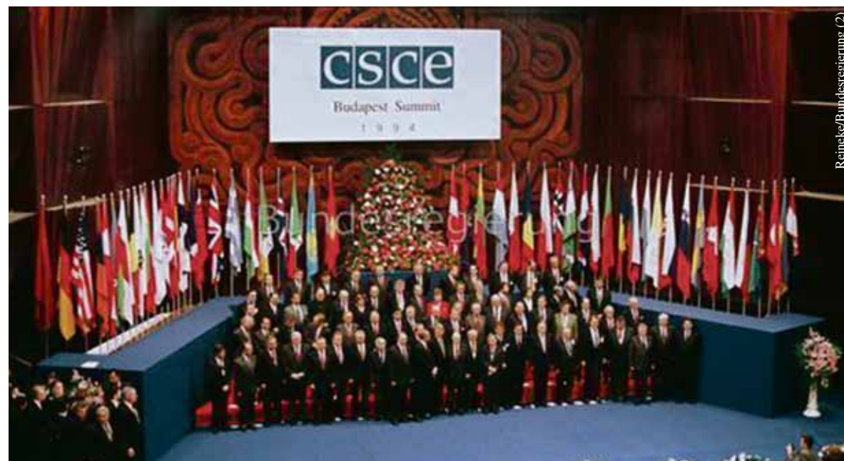
Ende der KSZE: Auf dem Gipfel im Dezember 1994 in Budapest wurde beschlossen, die KSZE mit Wirkung zum 1. Januar 1995 in Organisation für Sicherheit und Zusammenarbeit (OSZE) umzubenennen.